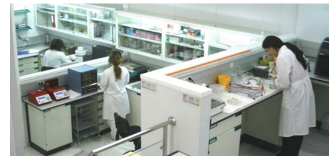
Instalaciones donde se realizará el curso

La entrega de la memoria se realizará vía email , una semana después de finalizar el curso y será evaluada. Durante este periodo se mantendrá el contacto con el profesorado del curso vía telefónica o mediante correo electrónico.